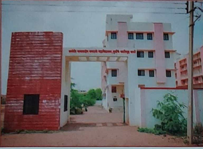
* मुलींच्या वसतिगृहाचे प्रवेशद्वार *