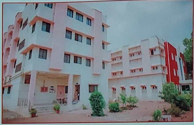
* मुलींच्या वसतिगृहाची इमारत *